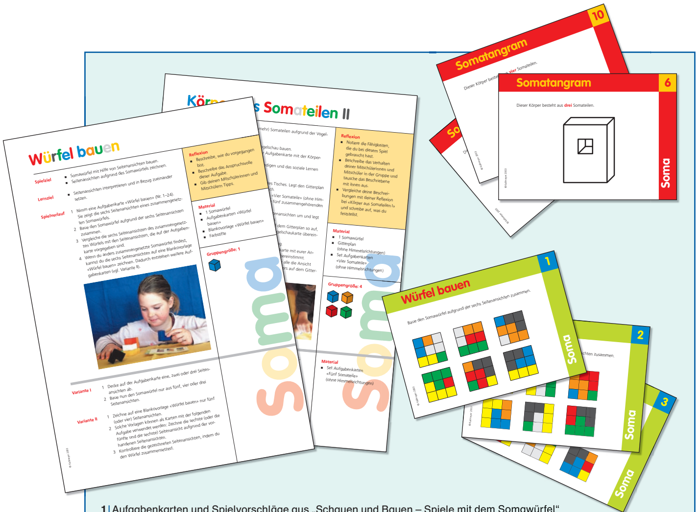
1 | Aufgabekarten und Spielvorschläge aus „Schauen und Bauen – Spiele mit dem Somawürfel“