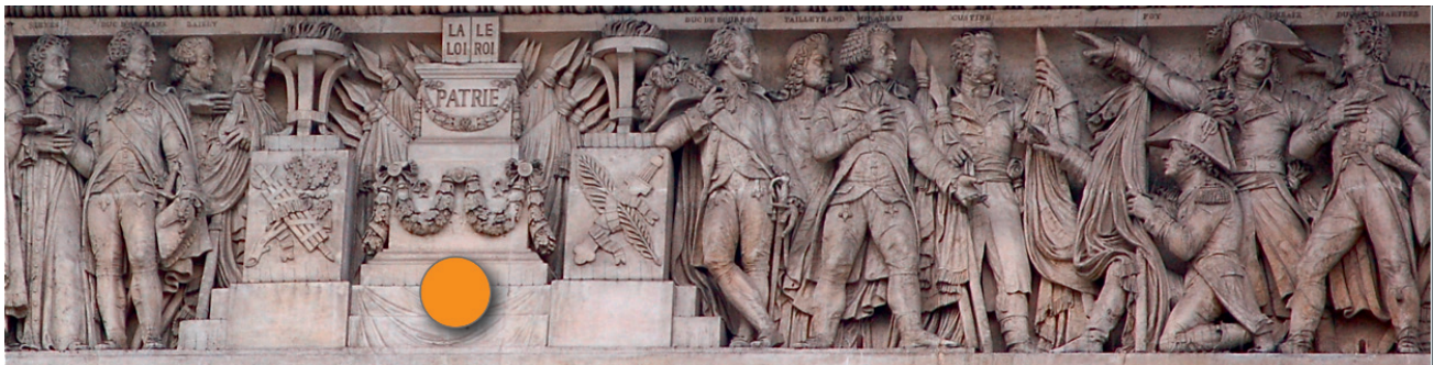
„Regierungsprogramm“ der Herrschaft Louis-Philippes