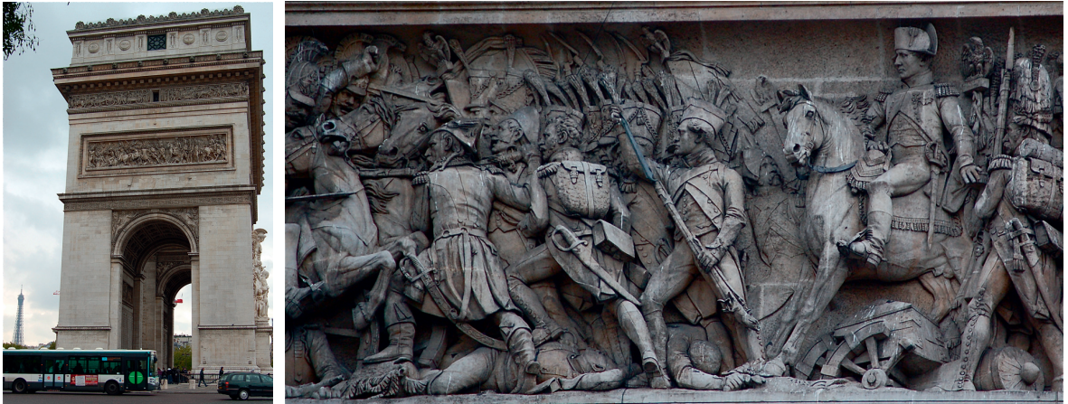
Der (36-jährige) Kaiser Napoleon in der Schlacht bei Austerlitz 1805 (Relief datiert 1836)