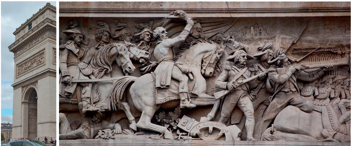
Der (19-jährige) Offizier Louis-Philippe bei der Einnahme des Ortes Jemmapes 1792. (Diese Darstellung des Herrschers entspricht eher seinem Aussehen im Alter von ca. 60 Jahren zur Zeit der Entstehung des Reliefs 1834.)