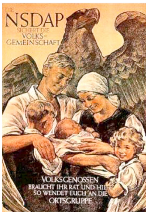
Plakat der NSDAP zur Volksgemeinschaft

Adolf Hitler: Mein Kampf 1925/1927. München 1933, S. 739 ff.