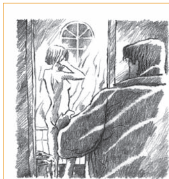
Carla Rosano Arguener Muñoz. Delante un crimen . Santillana, Madrid 1991, pág. 19