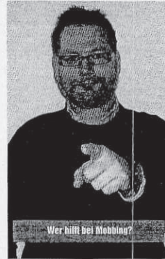
Wer hilft bei Mobbing?