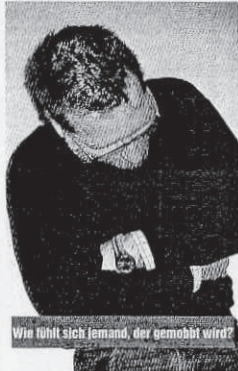
Wie fühlt sich jemand, der gemobbt wird?