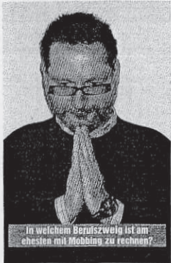
In welchem Berufszweig ist am ehesten mit Mobbing zu rechnen?