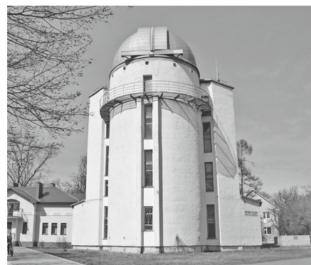
Die Sternwarte Kiew, der Instrumententurm mit musealen Ausstellungen. In der Kuppel befindet sich der Toepfer-Steinheil Doppelastrogroph (1912–1914) D vis. 300 mm, fotogr. 400 mm, f = 5500 mm.