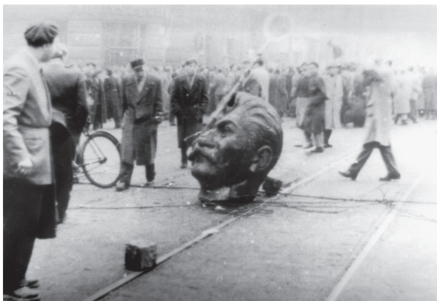
Bildersturm 1956: Aufständische in Budapest zerstören eine Statue des verhassten Stalin

Die Unterrichtssequenz setzt voraus, dass den Schülerinnen und Schülern die reformatorische Heilslehre und damit die Abkehr von der Werkgerechtigkeit bekannt sind. Als Einstieg wird ein Foto eines katholischen und eines reformierten Kirchenraums gegenübergestellt, um die Frage zu entwickeln, woher die Unterschiede hinsichtlich Bildern, Skulpturen und Schmuck resultieren. Danach beschäftigen sich die Lernenden anhand der Bilddar-