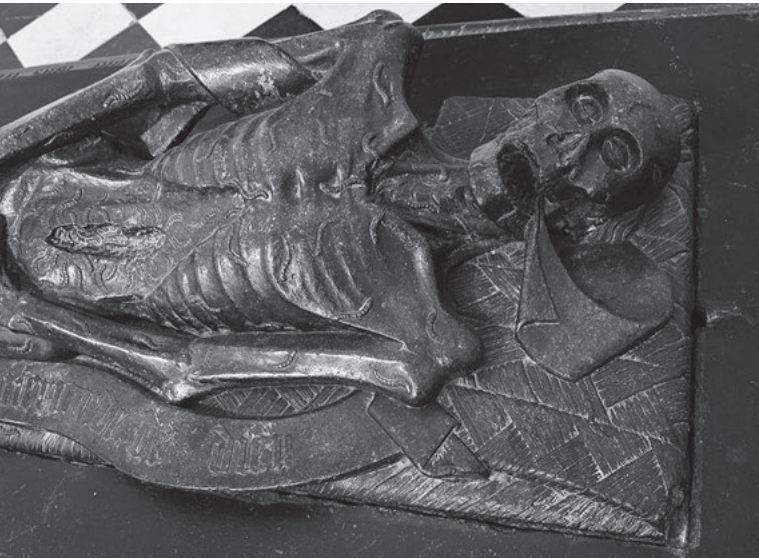
Transi auf dem Grabmal des Guillaume Lefranchois (um 1450): Hervorhebung des Verfallsprozesses