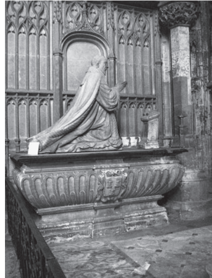
Priant des Claude Goulard (16. Jh.): ein um seine Erlösung ringendes Individuum