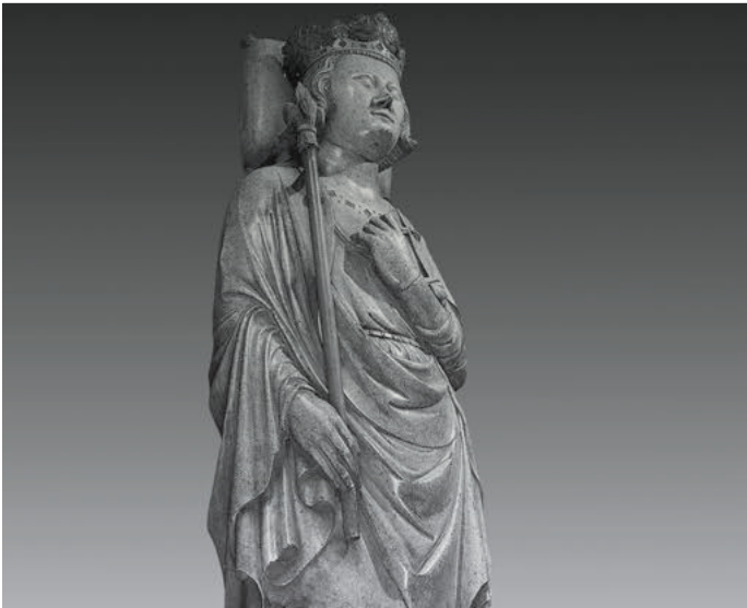
Ausdruck verschiedener Auffassungen des Todes in der Grabplastik: Gisant des Philippe le Bel (1327): der erlösungsgewiss Wartende