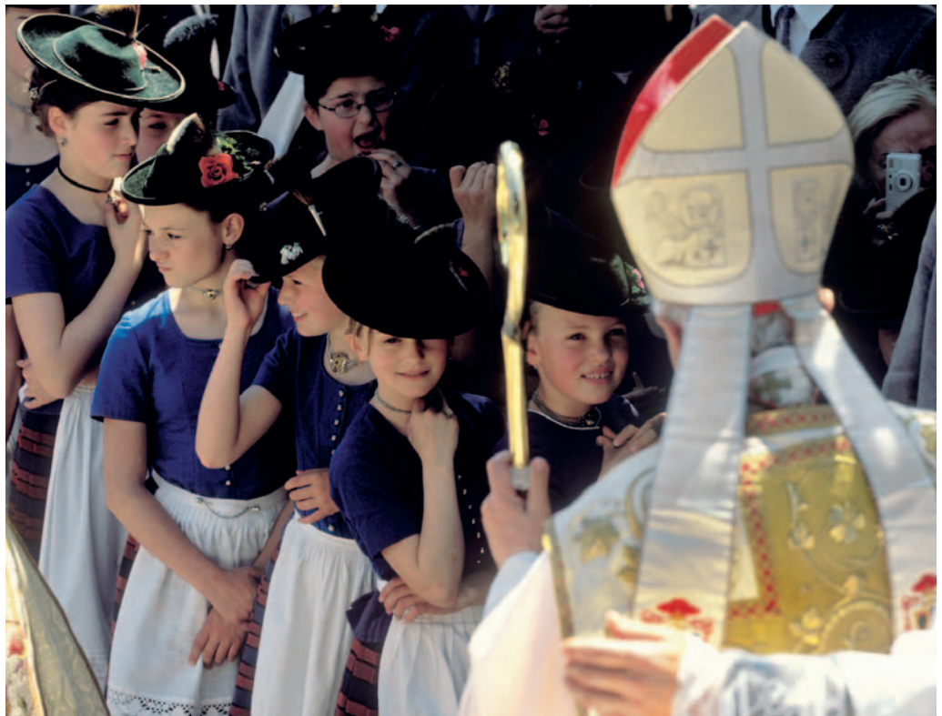
© Hans-Günther Kaufmann (Aus: „Joseph Kardinal Ratzinger/Benedikt XVI.: Was die Welt schön macht.“ Heyne Verlag 2005)