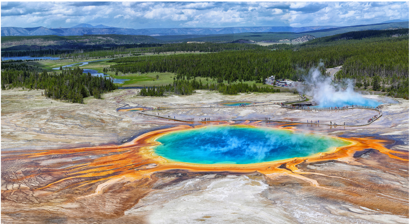
Abb. 1: Grand Prismatic Spring im Midway Geyser Basin des Yellowstone Nationalparks – diese heiße Quelle ist eines der „Wahrzeichen“ des Yellowstone-Vulkans