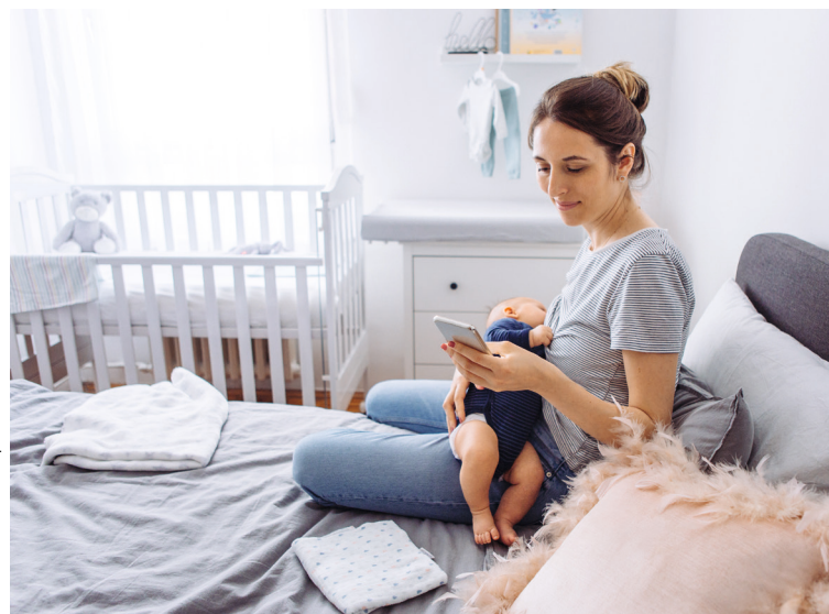
Beitrag auf Seite 36