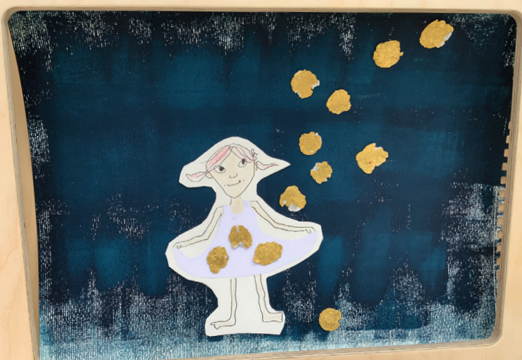
Abb. 1: E. Gangl