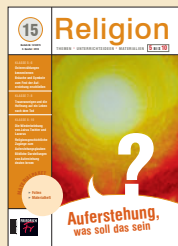
Titelfoto: Auferstehung © DER WOLF.