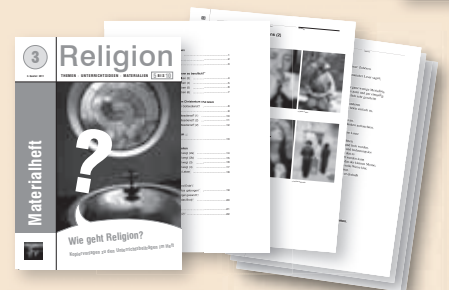
Materialheft mit Kopiervorlagen zu den Unterrichtsbeiträgen