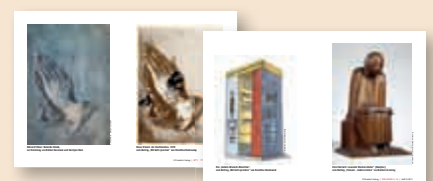
Folien mit Bildern zum Thema „Beten“