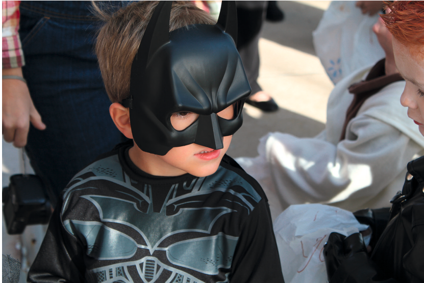
MaterialExtra Seite 9