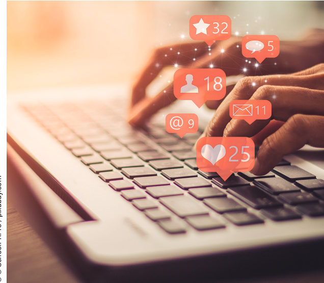
Beitrag auf Seite 19