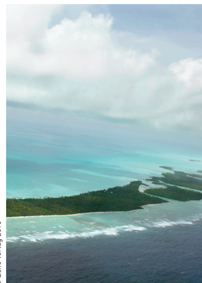
Beitrag auf Seite 18