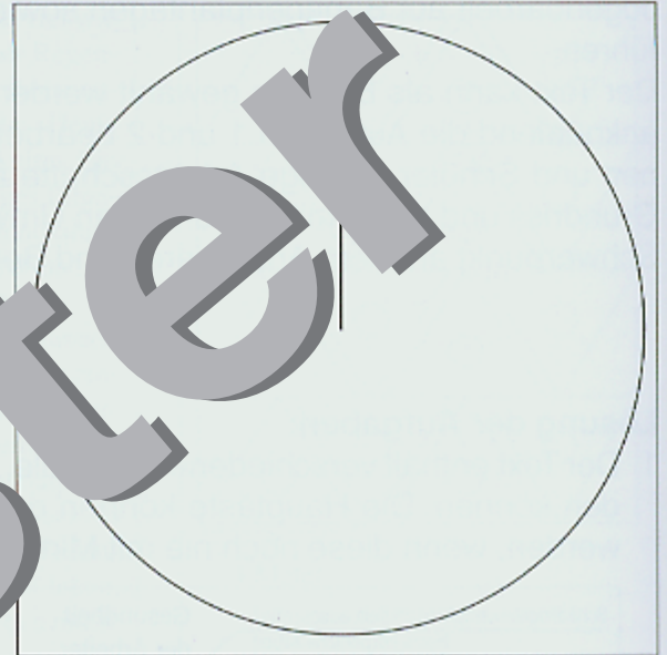
M 2: Kreisdiagramm zur Anbaumenge der einzelnen Länder Lateinamerikas