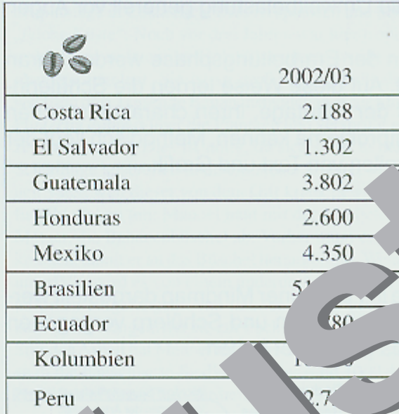
M 1: Kaffee-Ernten wichtiger Anbauländer in Lateinamerika – in 1.000 Sack à 60 kg