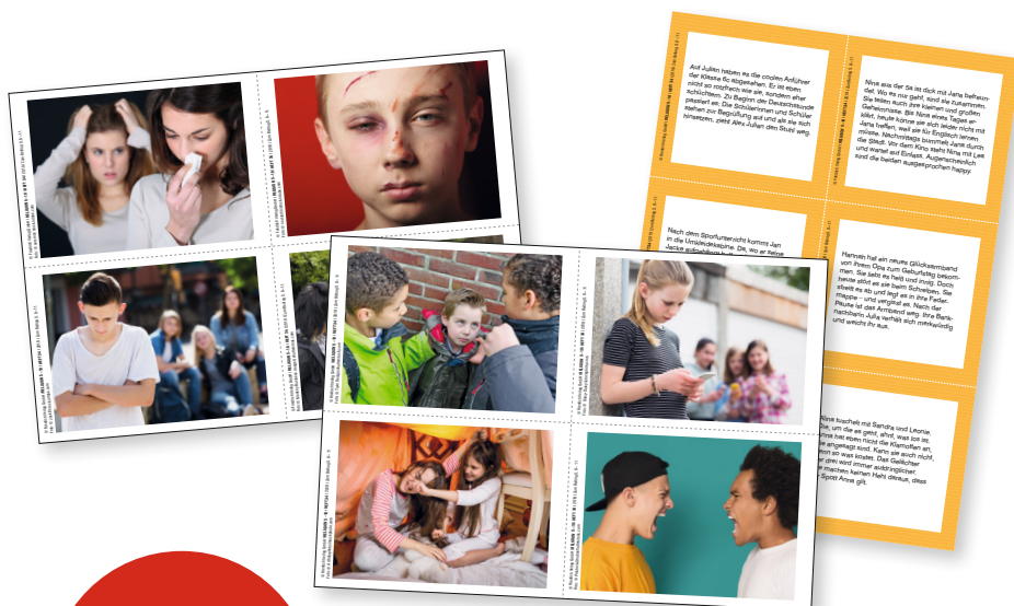
Bild- und Situationskarten zum Einstieg in das Thema, zur Erarbeitung des Begriffs "Gewalt", für Rollenspiele